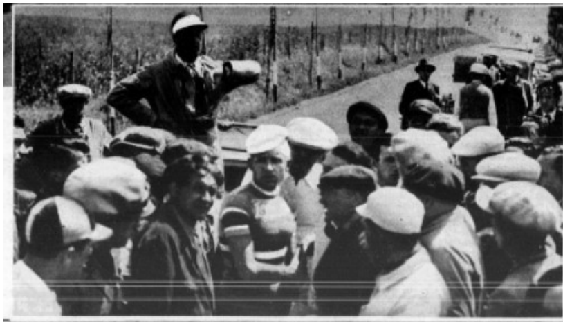
Il ritiro di Binda a Roma