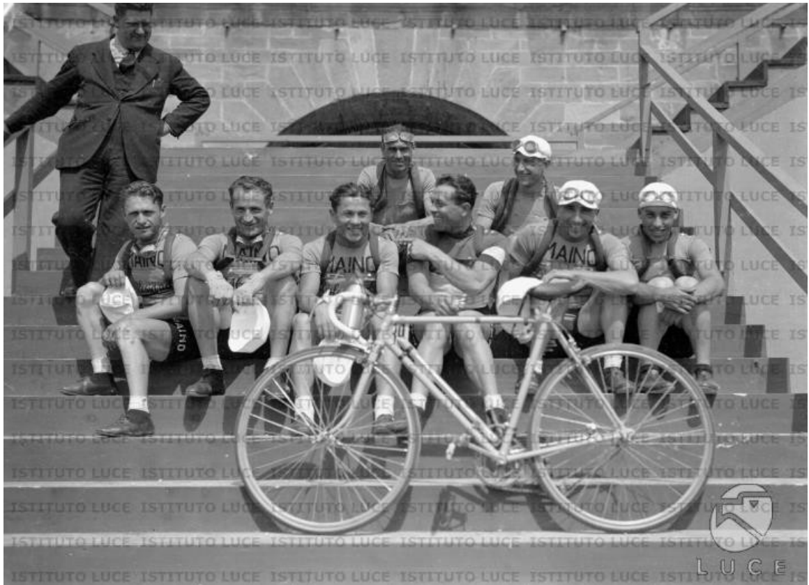
Guerra con la Maino al completo